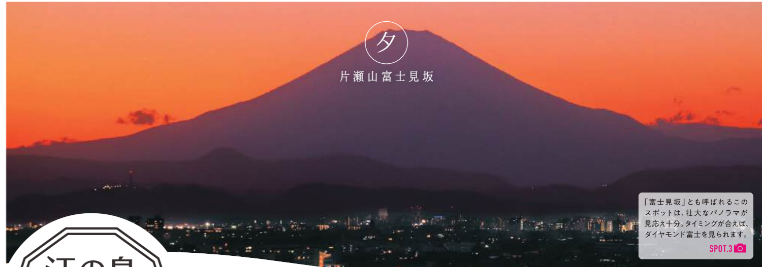
夕 片瀬山富士見坂

「富士見坂」とも呼ばれるこのスポットは、壮大なパノラマが見応え十分。タイミングが合えば、ダイヤモンド富士を見られます。