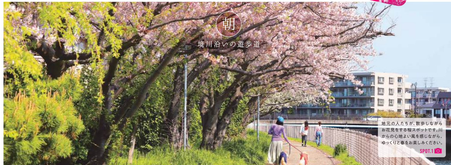
朝 境川沿いの遊歩道

地元の人たちが、散歩しながらお花見をする桜スポットです。川からの心地よい風を感じながら、ゆっくりと春をお楽しみください。