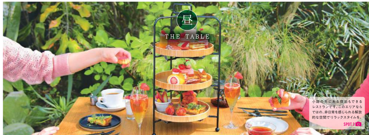
昼 THE TABLE

小路の先にある宿泊もできるレストランです。このエリアならではの、非日常を感じられる解放的な空間でリラックスタイムを。