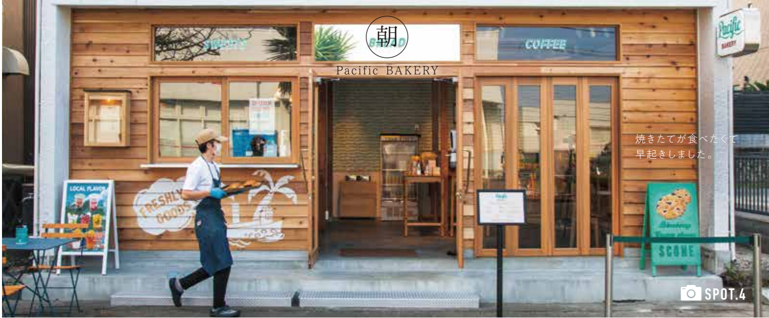
焼きたてが食べたくて早起きました。