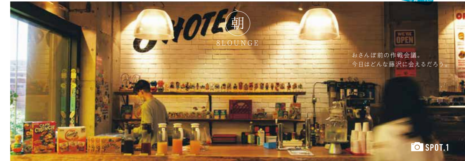
おさんぽ前の作戦会議。 今日はどんな藤沢に会えるだろう。