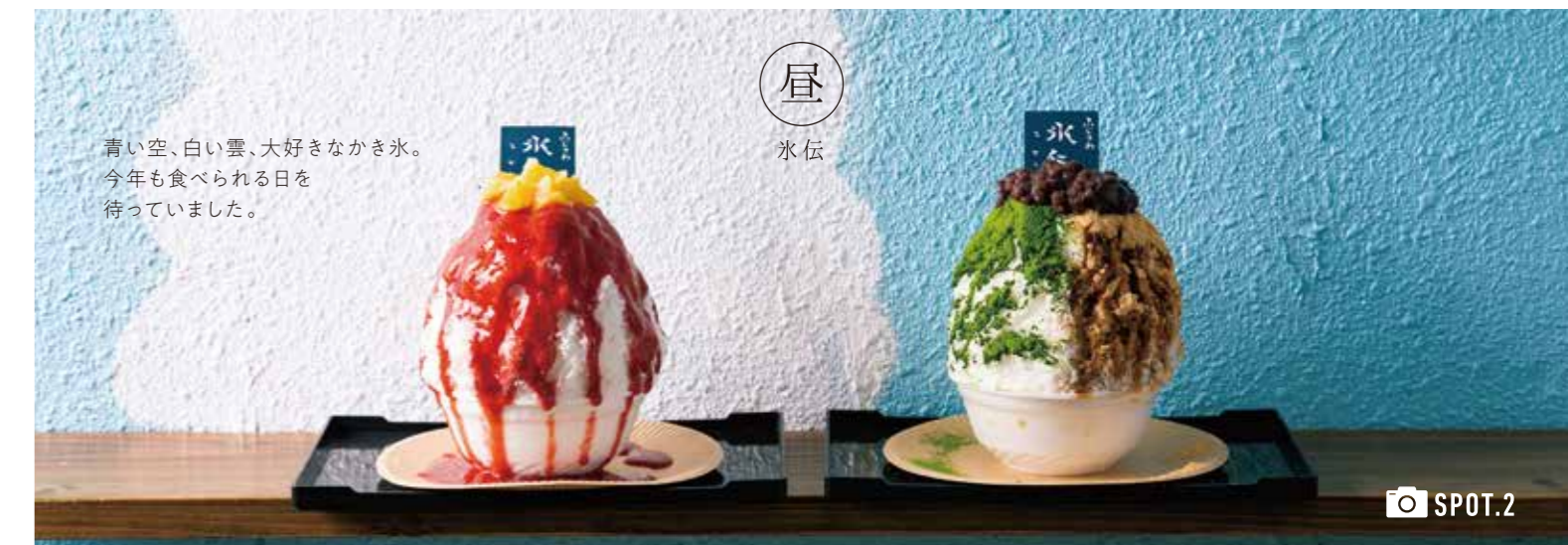
青い空、白い雲、大好きなかき氷。 今年も食べられる日を 待っていました。