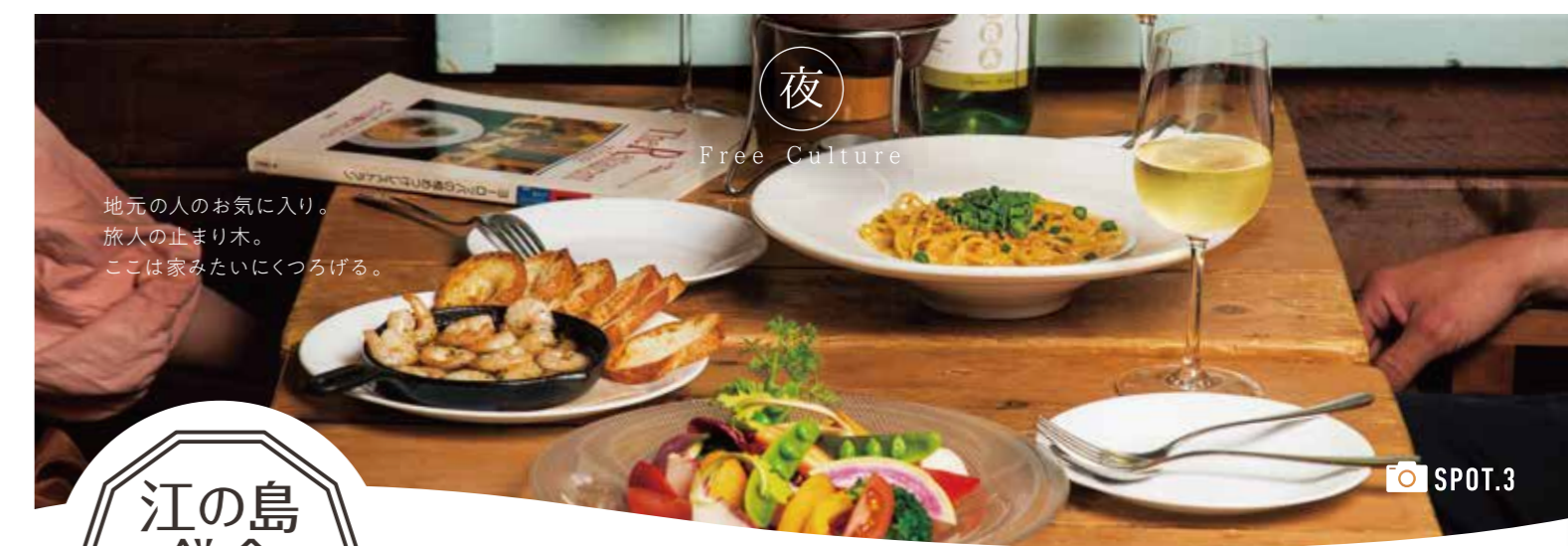
地元の人のお気に入り。 旅人の止まり木。 ここは家みたいにくつろげる。