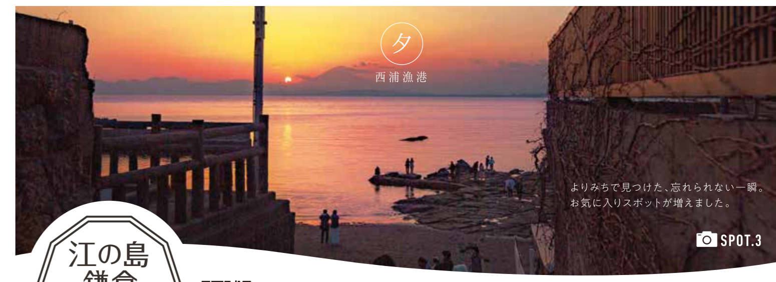
よりみちで見つけた、忘れられない一瞬。お気に入りのスポットが増えました。