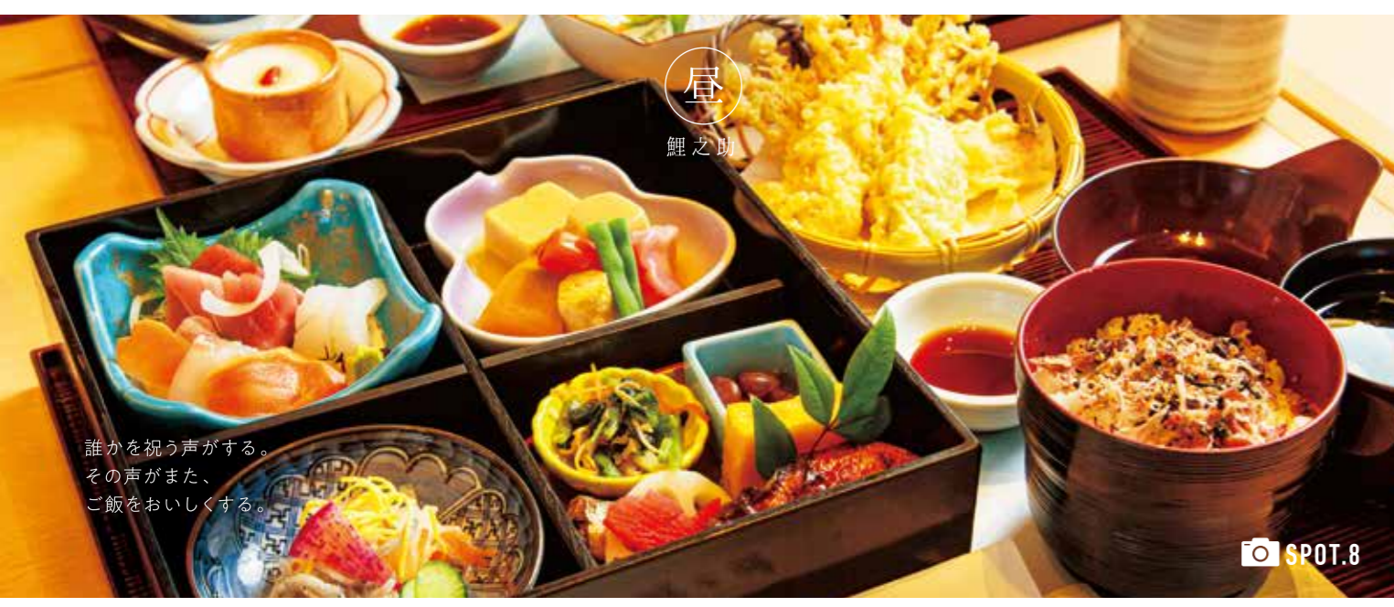
誰かを祝う声がある。その声があった、ご飯をおいしくする。