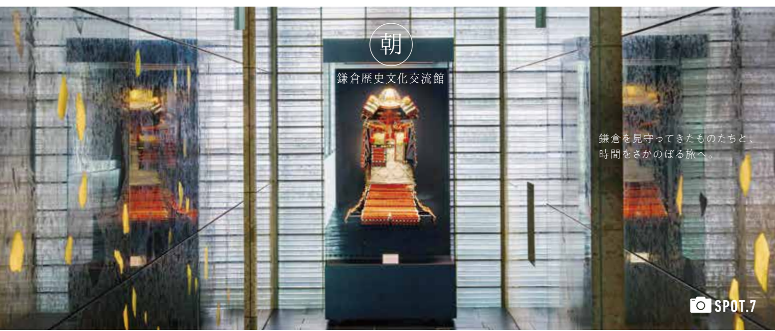
鎌倉を見守ってきたものたちと、時間をさかのぼる旅へ。