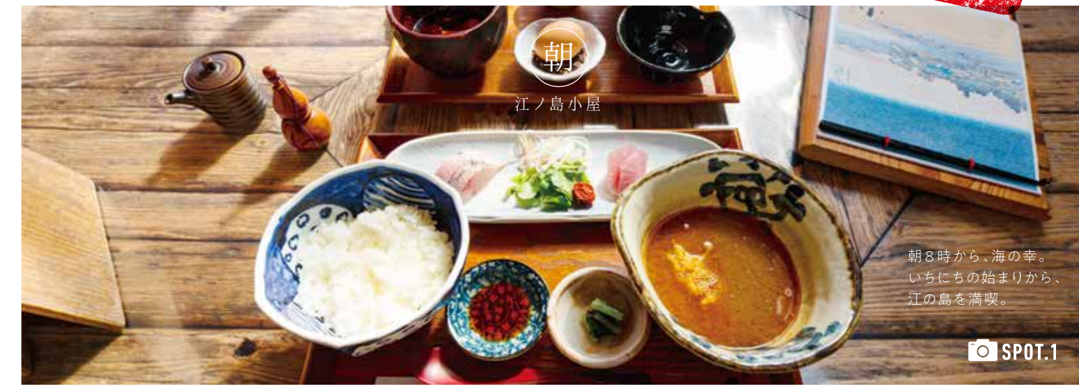
朝8時から、海の幸。いちにちの始まりから、江の島を満喫。