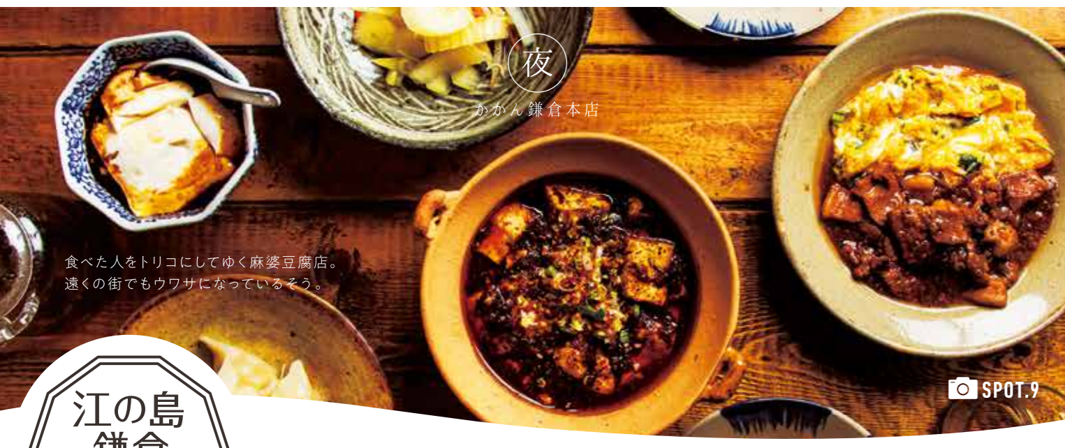
食べた人をトリコにしてゆく麻婆豆腐店。遠くの街でもウワサになっているそう。