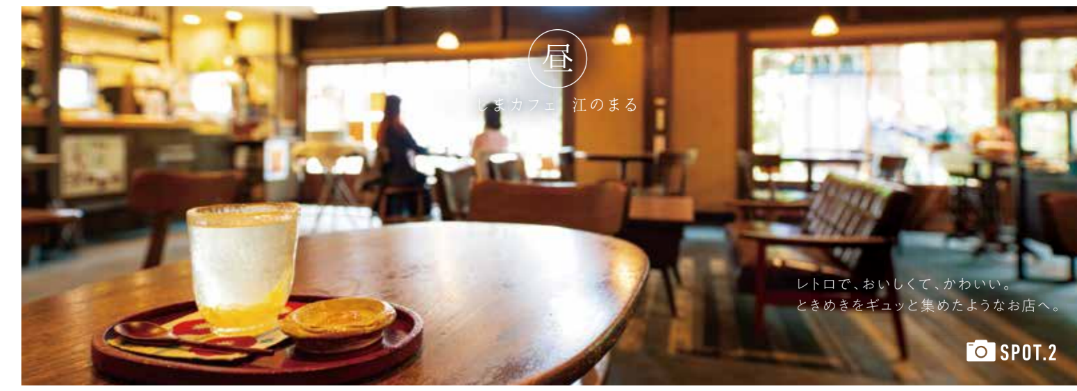
レトロで、おいしくて、かわいい。ときめきをギュッと集めたようなお店へ。