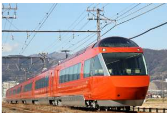
PayPayで特急券を購入いただけるようになる 特急ロマンスカー