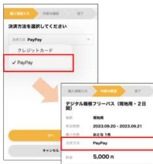
アプリ「EMot」のPayPay決済選択画面

当社グループでは、2023年8月に箱根エリアの交通網で国際ブランドのタッチ決済とデジタルチケットのQR認証を導入するなど、スマートな移動によるご旅行の利便性向上を図っています。2024年3月までに、アプリ・サイトへ中国のスマートフォン決済サービス「Alipay」の導入を予定しており、多様化が続くお客さまニーズやインバウンドの動向を捉えながら機能の拡充を推進してまいります。