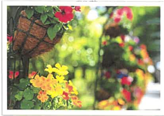
江の島サムエル・コッキング苑に咲く、 色鮮やかな花たち